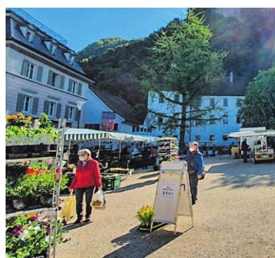
Szene vom Wochenmarkt in Hohenems.

Für die Verkehrsberuhigungsmaßnahmen, die ab dem Jahr 2016 durchgeführt wurden und durch die die Zahl der Geschäfte im Zentrum gesteigert wurde, erhielt Hohenems im Jahr 2017 bereits den Mobilitätspreis des Verkehrsclubs Österreich (VCO). Das neue Konzept wird dort als „Schritt in die richtige Richtung“ gelobt, doch sollte außer auf Landesstraßen generell maximal Tempo 30 im Stadtgebiet gelten, so die Organisation.